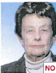
Testa non centrata

La testa deve essere centrata verticalmente.