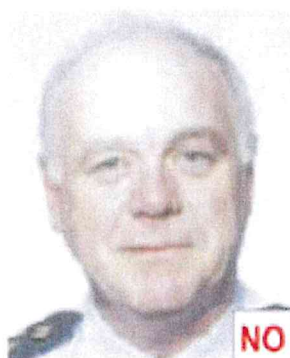
Riflesso del flash