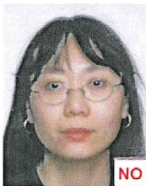
Montatura copre occhi