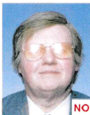
Riflesso sulle lenti