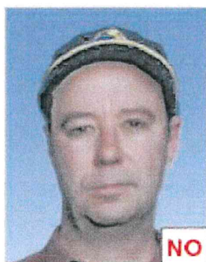
Indossa il berretto