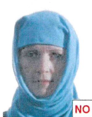
Parte del viso coperta