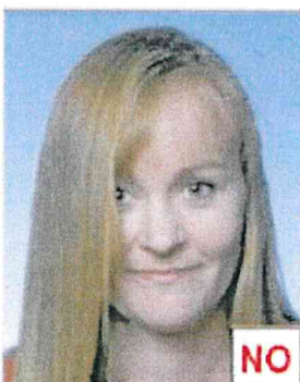
Occhi coperti da capelli

Gli occhi non devono essere coperti da capelli.