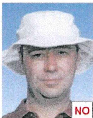
Indossa il cappello

Non sono ammessi copricapo a meno di motivi religiosi, culturali o medici. In ogni caso il volto deve essere mostrato chiaramente.