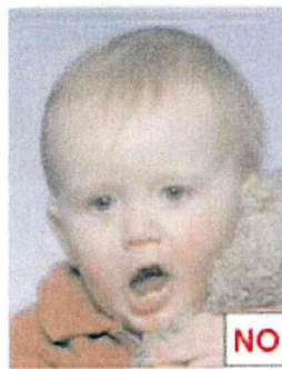
Oggetto in evidenza